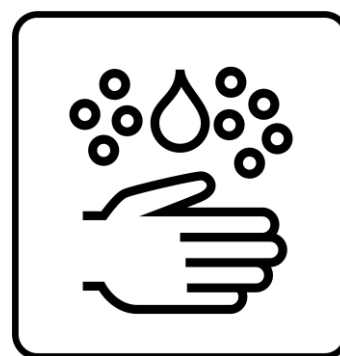
Gründlich Hände waschen und desinfizieren